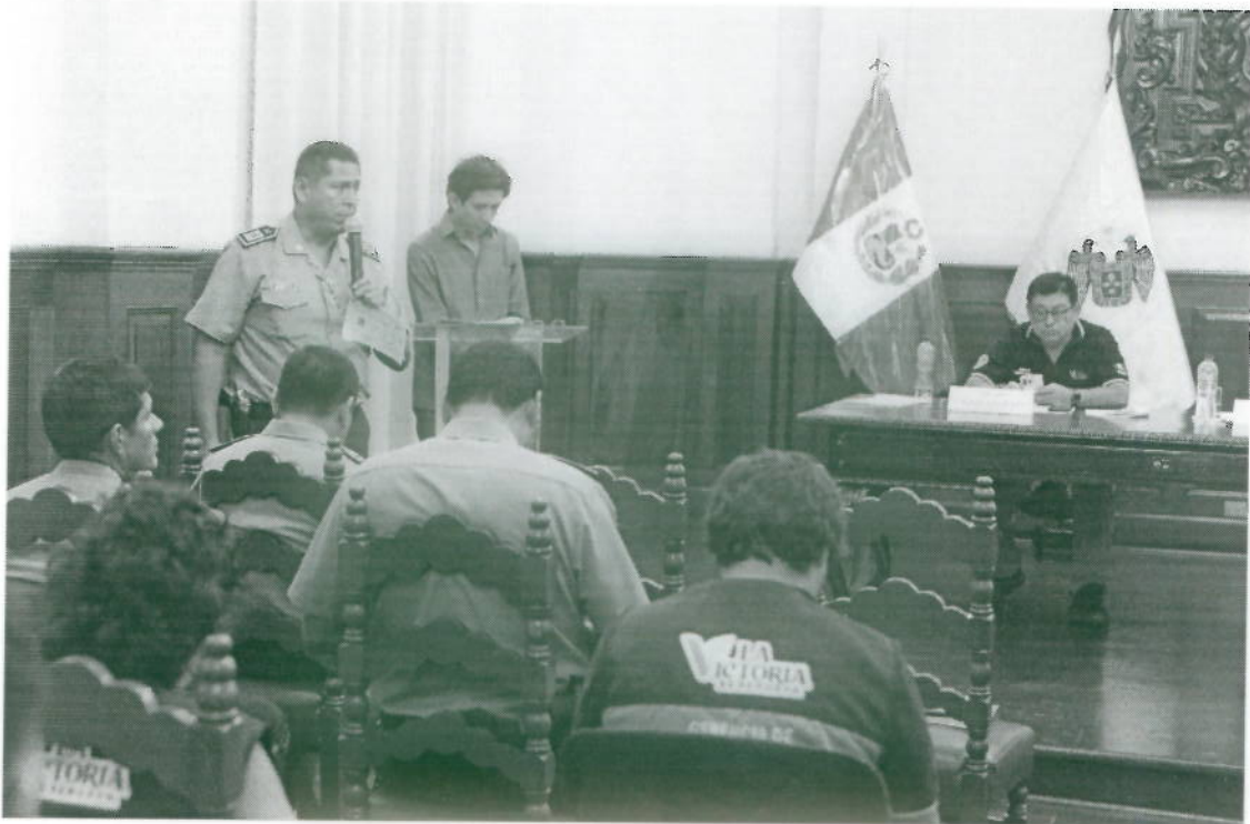
Fotografía 3: "1ra. Consulta Pública del 2024 del CODISEC LA VICTORIA"